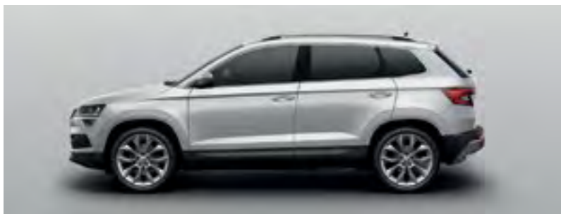
ARGINTIU BRILIANT METALIZAT