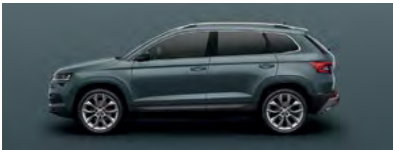
GRI QUARTZ METALIZAT