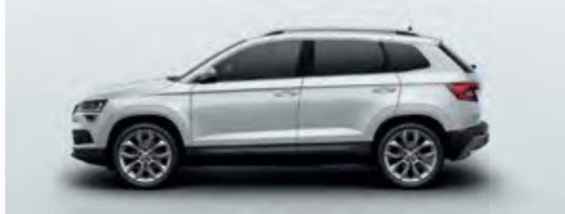
ALB MOON METALIZAT