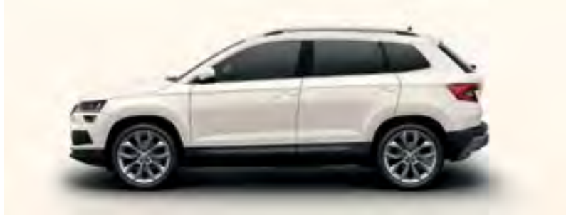
ALB CANDY UNI