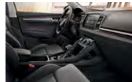
INTERIOR STYLE NEGRU Decor Crom/Dark Brushed Tapiterie textilă