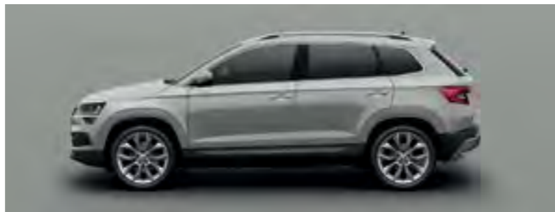
GRI STEEL UNI