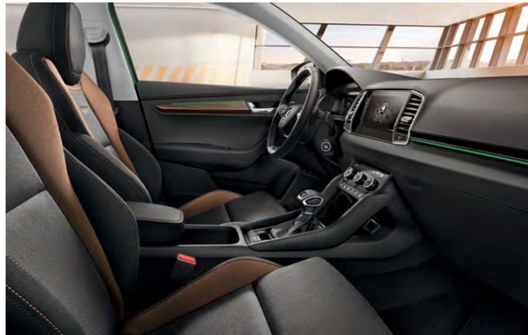
INTERIOR SCOUT NEGRU Decor Negru Piano/Ash Brown Tapițerie textilă