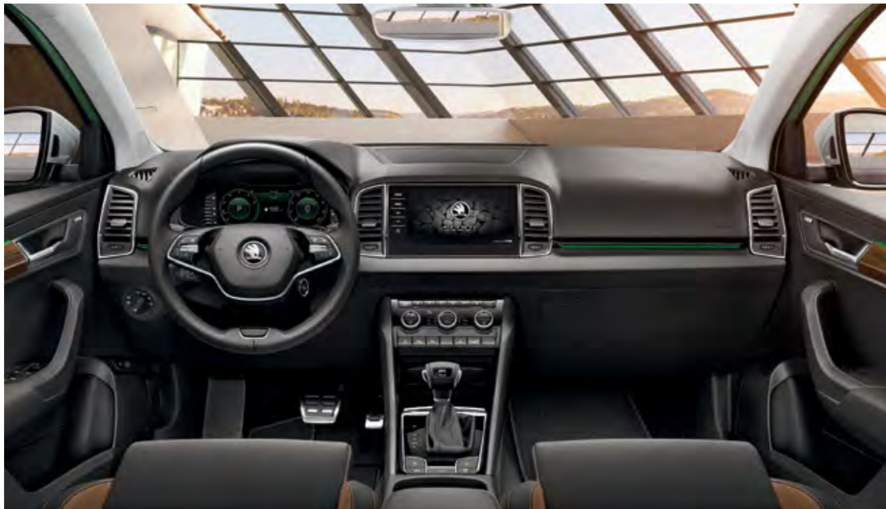
INTERIOR SCOUT NEGRU Decor Negru Piano/Ash Brown Tapițerie textilă

KAROQ SCOUT vă va răsfăța cu numeroase dotări moderne, ca de pildă cu volanul multifuncțional îmbrăcat în piele sau iluminarea ambientală cu LED ce vă oferă 10 opțiuni diferite pentru culori, astfel încât să puteți crea atmosfera optimă în fiecare călătorie. Puteți, de asemenea, opta pentru Virtual Cockpit și pentru sistemul de navigație Columbus cu ecran de 9,2 inchi cu comandă tactilă și comandă prin gesturi.