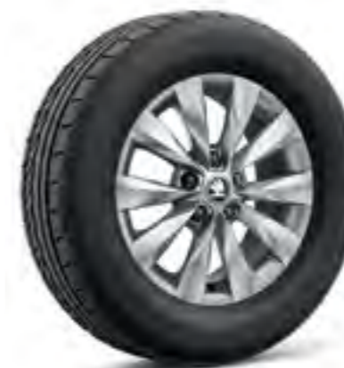
Jante de 16" CASTOR din aliaj ușor