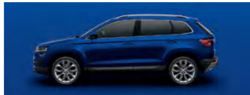
ALBASTRU ENERGY UNI