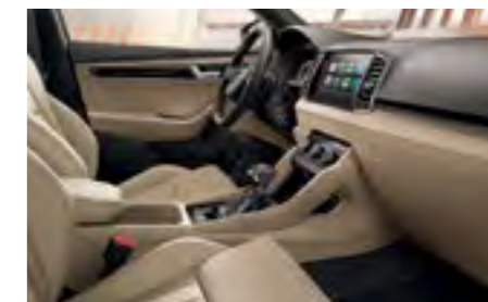
INTERIOR STYLE PIELE BEJ Decor Negru Piano/Dark Waves Tapiterie din piele/piele ecologică, plafon interior negru