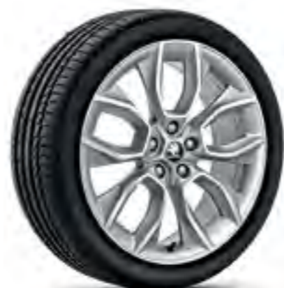
Jante de 19" CRATER antracit din aliaj ușor, polișate**