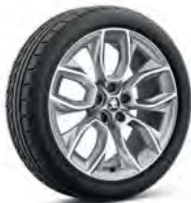
Jante de 19" CRATER din aliaj ușor