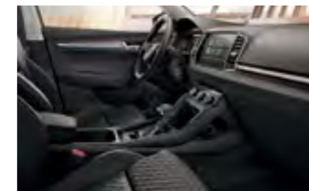
INTERIOR STYLE TEXTIL/PIELE NEGRU Decor Crom/Dark Brushed Tapiterie textilă bej/piele/piele ecologică

* Scaunele acoperite cu piele/piele ecologică neagră sunt disponibile și pentru linia de echipare Ambition.