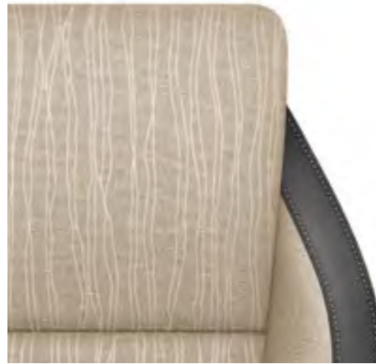
Textil Bej/Textil Negru – Style