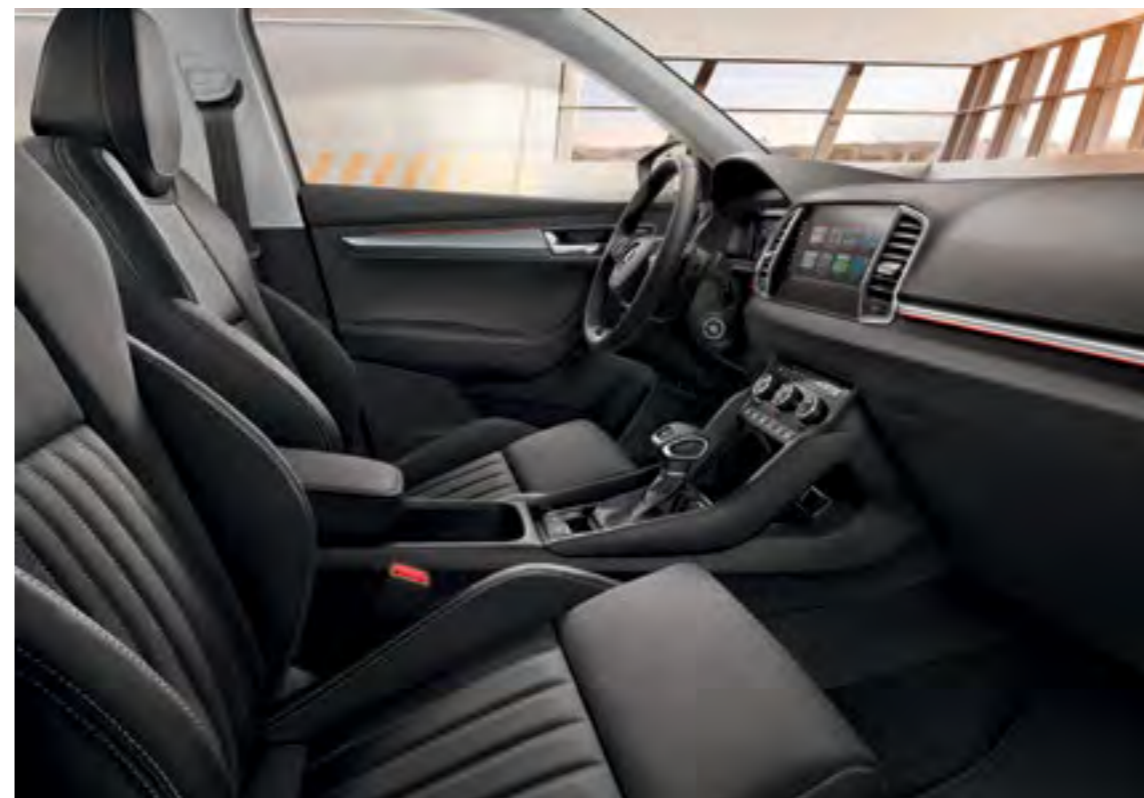
INTERIOR STYLE PIELE NEGRU Decor Crom/Dark Brushed Tapiterie din piele/piele ecologică*