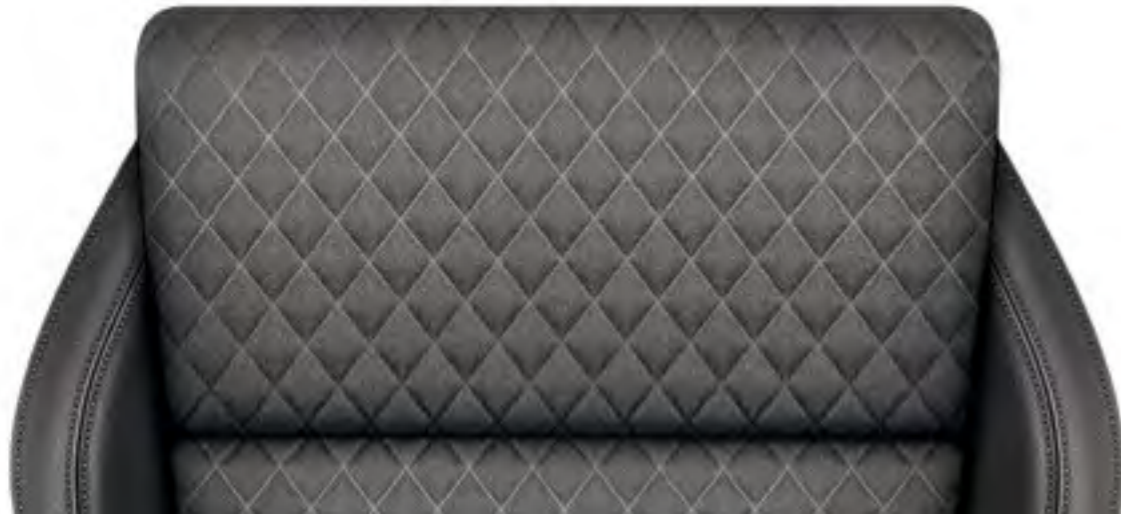
Textil Negru/Piele/Piele ecologică Neagră – Ambition*, Style*