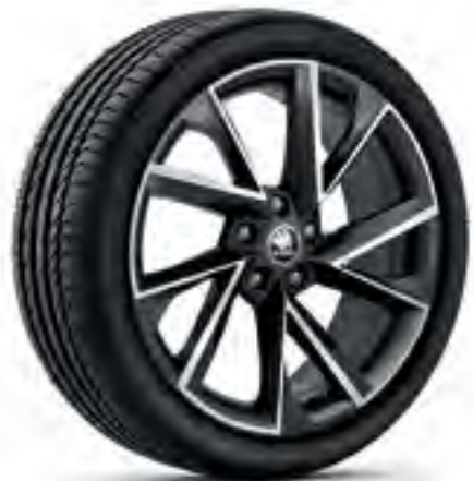
Jante de 19" VEGA negre din aliaj ușor, polișate*