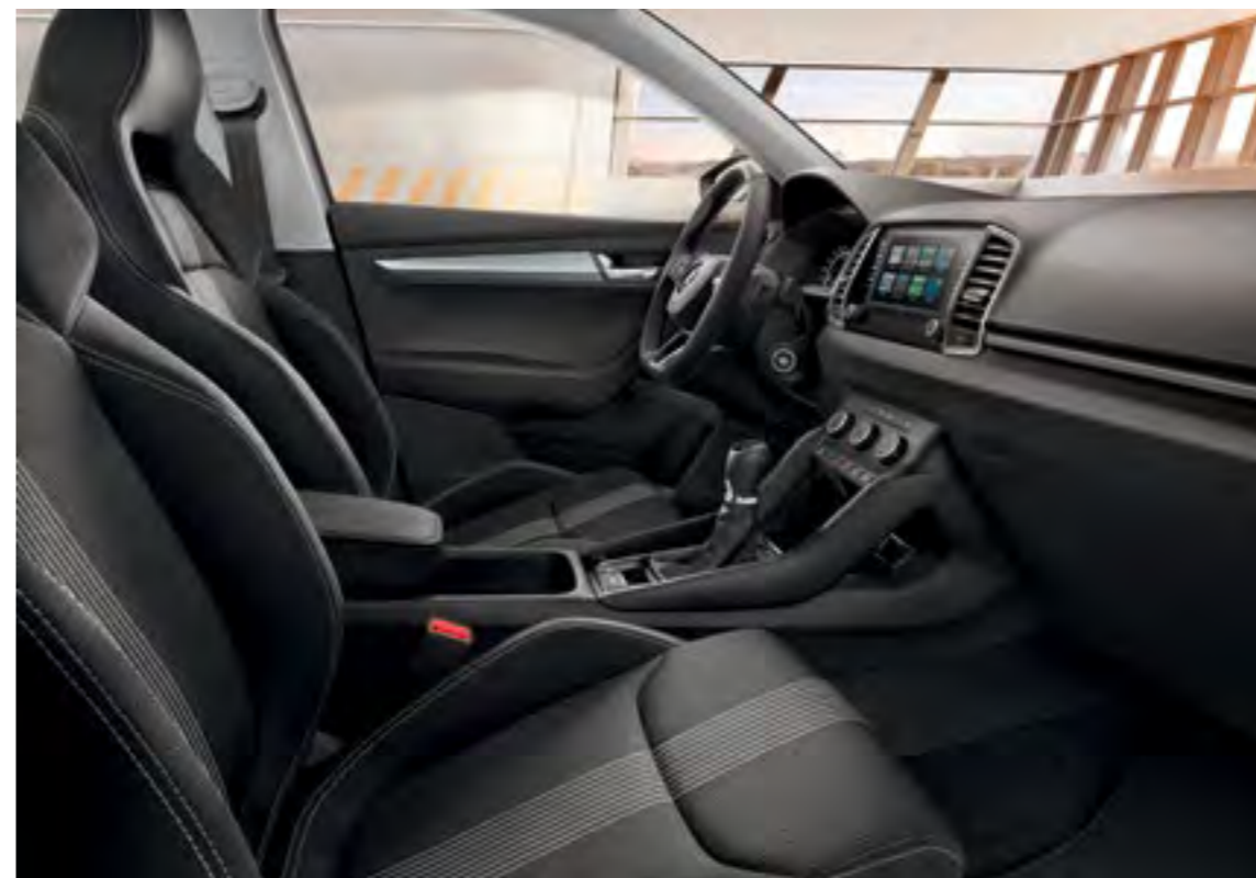
INTERIOR AMBITION CU SCAUNE SPORT NEGRU/ALB Decor Gri Graphite/Cool Brushed Tapițerie textilă*