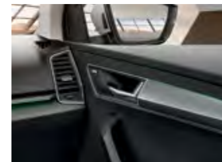
Iluminare ambientală verde

ILUMINAREA AMBIENTALĂ Puteți alege culoarea dumneavoastră preferată sau vă puteți completa fiecare zi cu o altă nuanță. Bordul și iluminarea ambientală cu LED-uri din portierele din față, inclusă în pachetul LED, oferă 10 opțiuni atractive de culoare. Iluminarea albă de la nivelul picioarelor este, de asemenea, inclusă în pachetul LED.