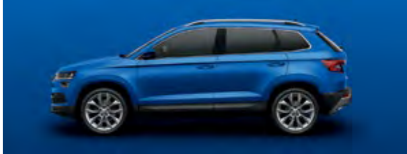
ALBASTRU RACE METALIZAT