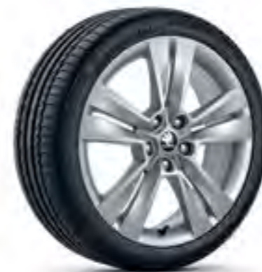
Jante de 18" MYTIKAS din aliaj ușor