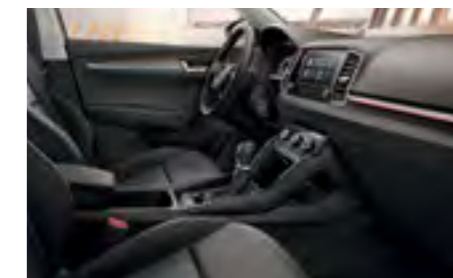
INTERIOR AMBITION NEGRU/GRI Decor Crom/Dark Brushed Tapițerie textilă