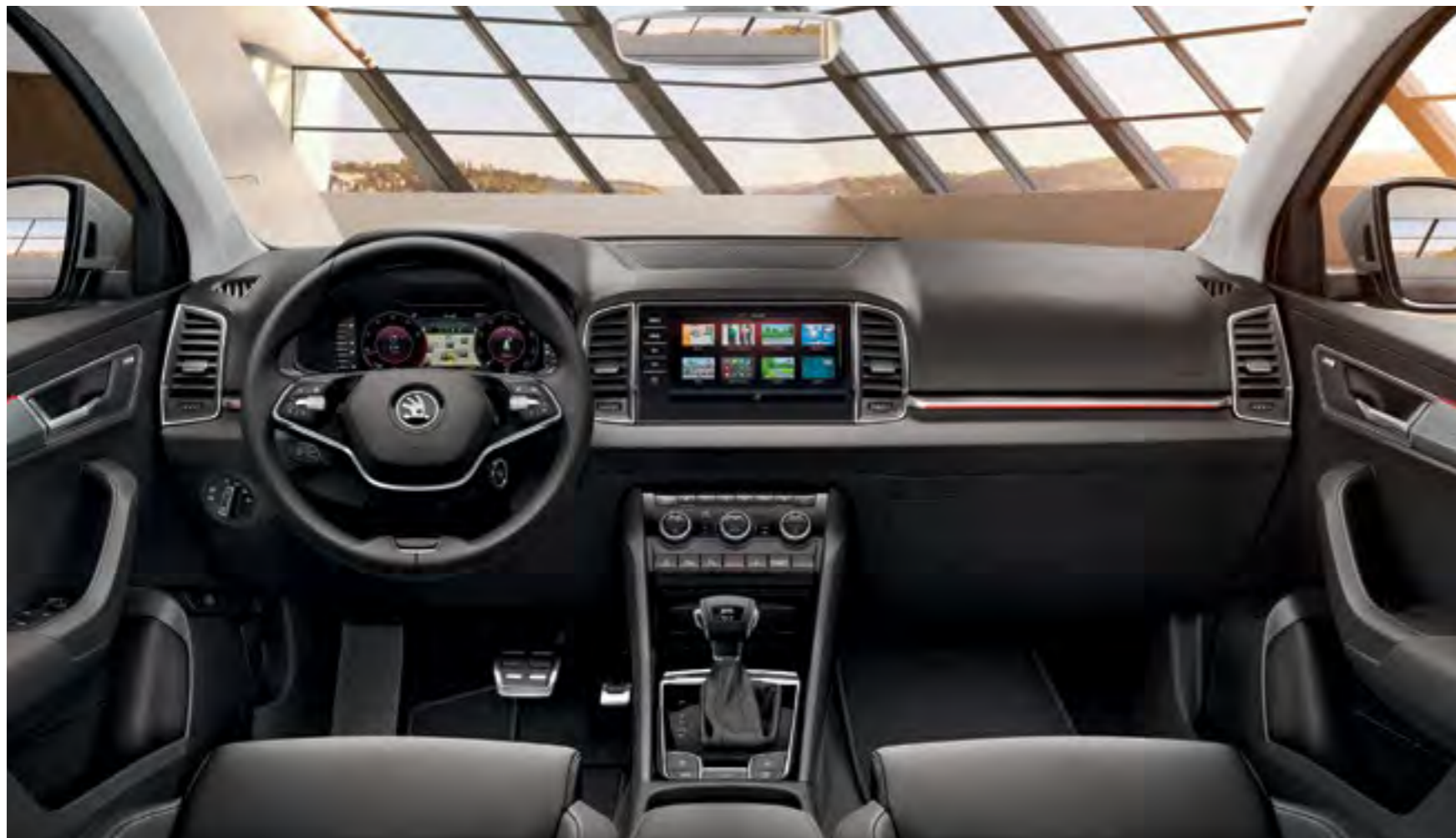
INTERIOR STYLE PIELE NEGRU Decor Crom/Dark Brushed Tapiterie piele/piele ecologică

Dotările standard ale liniei de echipare Style includ ramele cromate la geamurile laterale, sistemul de climatizare Climatronic cu reglaje pe două zone, iluminarea difuză și multe altele.