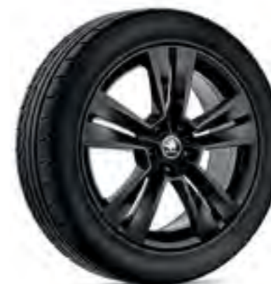
Jante de 18" MYTIKAS negre din aliaj ușor*