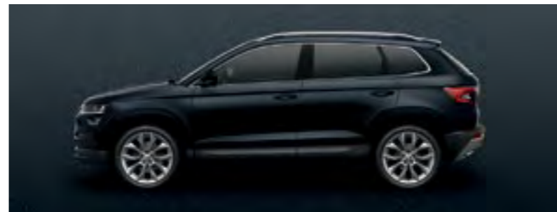
NEGRU CRYSTAL METALIZAT