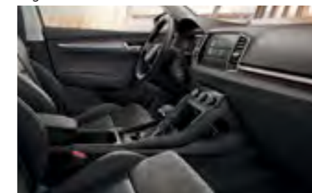
INTERIOR STYLE SUEZIA NEGRU Decor Crom/Dark Brushed Tapiterie textilă Suedia/piele/piele ecologică