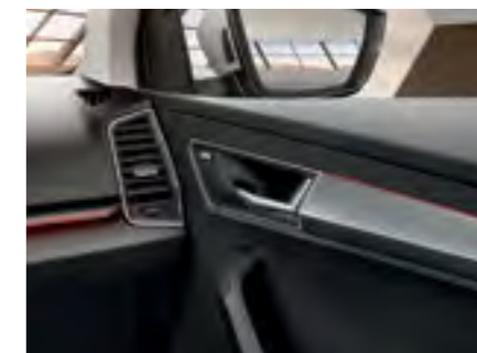
Iluminare ambientală roșie