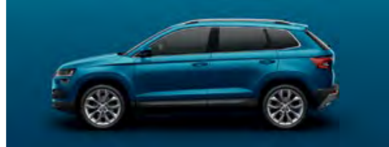
ALBASTRU LAVA METALIZAT