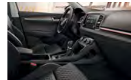
INTERIOR AMBITION TEXTIL/PIELE NEGRU Decor Crom/Dark Brushed Tapițerie textilă bej/pielă/pielă ecologică