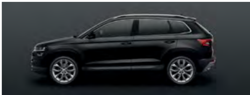
NEGRU MAGIC METALIZAT