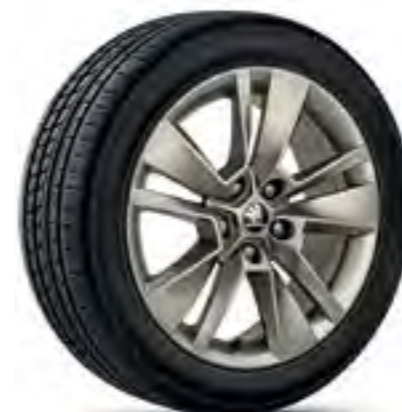
Jante de 17" TRITON din aliaj ușor