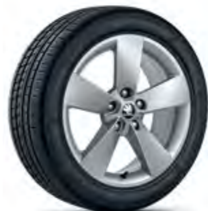
Jante de 17" RATIKON din aliaj ușor