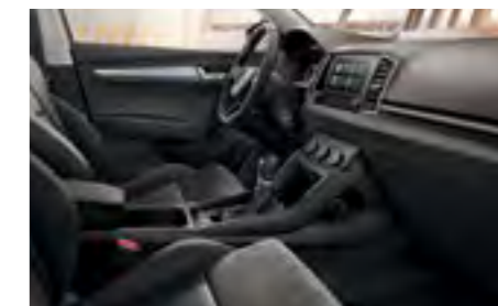
INTERIOR AMBITION SUEZIA NEGRU Decor Gri Graphite/Cool Brushed Tapițerie textilă Suedia/pielă/pielă ecologică