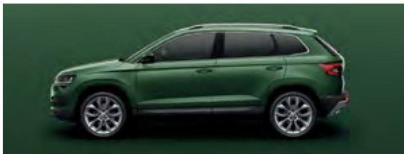
VERDE EMERALD METALIZAT