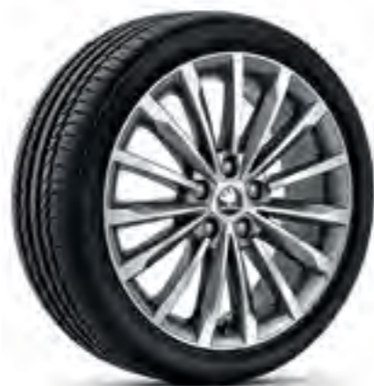
Jante de 18" TRINITY antracit din aliaj, polișate