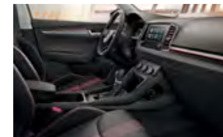
INTERIOR AMBITION CU SCAUNE SPORT NEGRU/ROȘU Decor Crom/Dark Brushed Tapițerie textilă*

* Scaunele sport sunt disponibile și pentru linia de echipare Style.