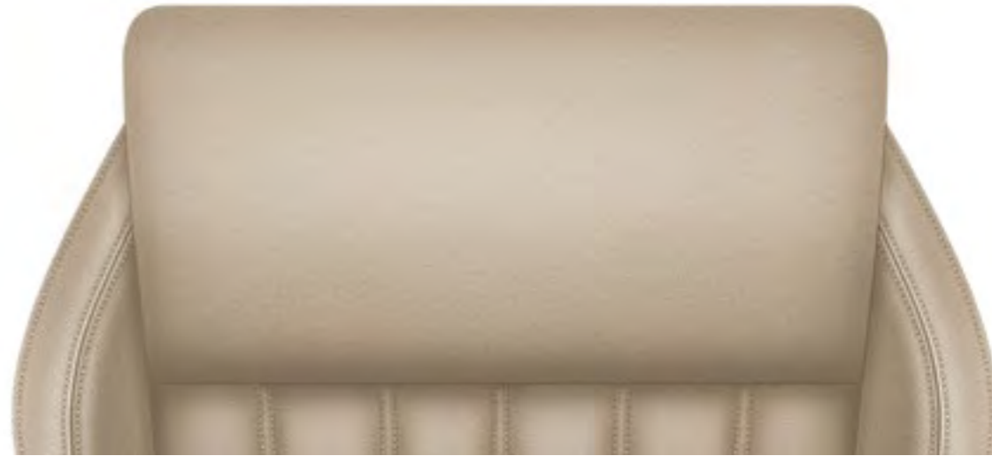
Piele/Piele ecologică Bej – Style*