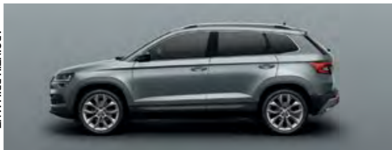
GRI BUSINESS METALIZAT