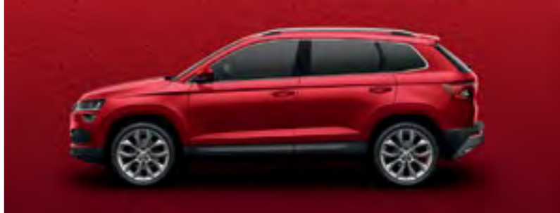
ROSU VELVET METALIZAT