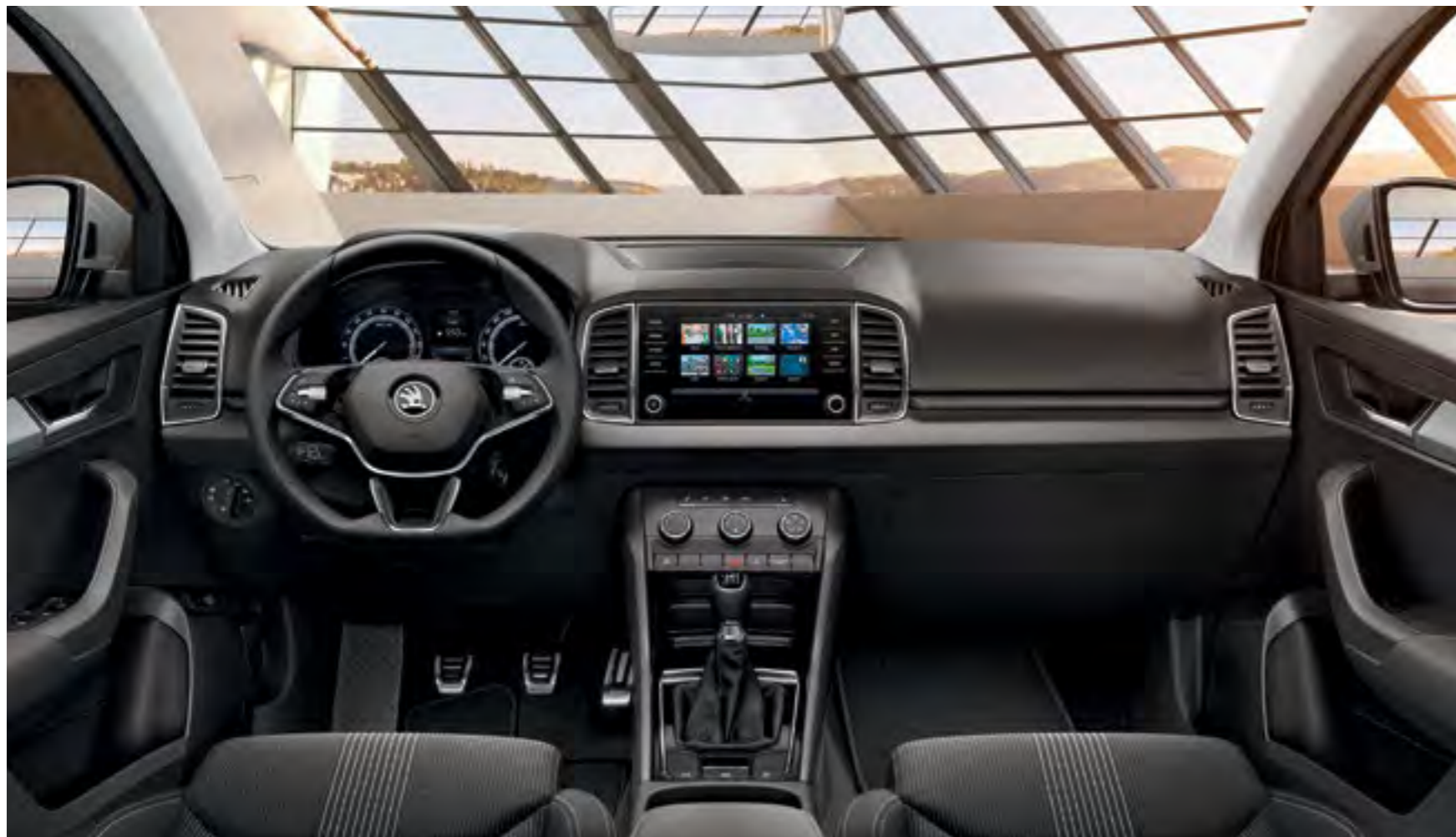
INTERIOR AMBITION CU SCAUNE SPORT NEGRU/ALB Decor Gri Graphite/Cool Brushed Tapițerie textilă*

Versiunea de echipare Ambition include în dotarea standard carcasele oglinzilor exterioare și mânerele exterioare ale portierelor vopsite în culoarea caroseriei, bare negre pe plafon, funcția KESSY GO (pentru pornirea și oprirea fără cheie a motorului), compartimentul Jumbo Box, compartimente de depozitare pentru umbrele în față, setul de plase pentru portbagaj, plus multe altele.