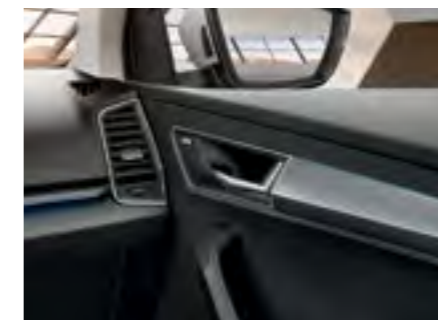
Iluminare ambientală albastră