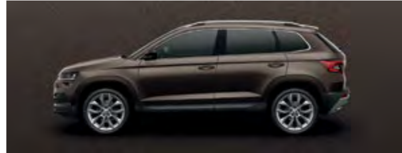
MARO MAGNETIC METALIZAT