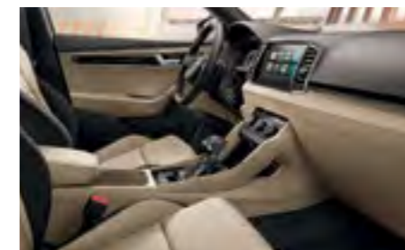
INTERIOR STYLE BEJ Decor Negru Piano/Dark Waves Tapiterie textilă, plafon interior negru